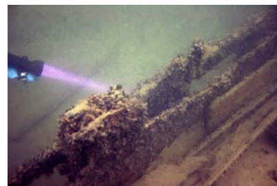
Bordläggning 1700 tal