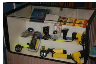
Lite olika lampor