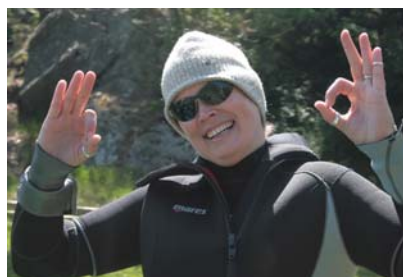
Glasögonen ska med under vattnet!

NOC DYK & MARIN Järnvägsgatan 1 149 31 NYNÄSHAMN SWEDEN